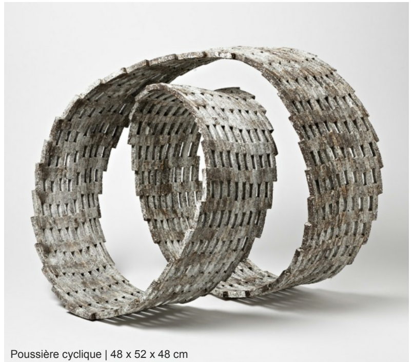
Poussière cyclique | 48 x 52 x 48 cm

+33 (0)6 71 56 53 04 / + 33 (0)6 71 25 82 19