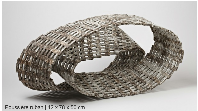
Poussière ruban | 42 x 78 x 50 cm