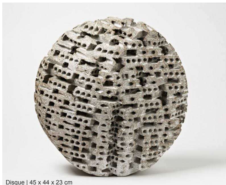
Disque | 45 x 44 x 23 cm