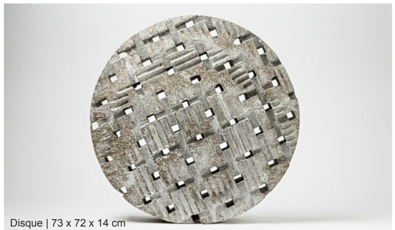
Disque | 73 x 72 x 14 cm

Né en 1965 à Yokohama, Maarten Stuer est un sculpteur d'origine flamande.