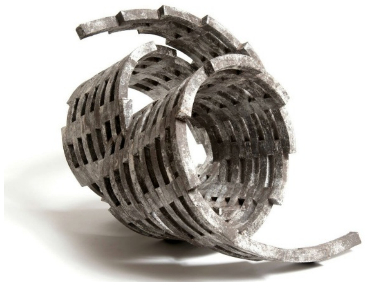
Tourbillon | 48 x 50 x 60 cm

Mon propos se concrétise en plusieurs entités : poussières, coquillages, vagues, feuilles, nuages, cyclones, sons, phrases, flammes, et disques. C'est un tour d'horizon très personnel du cosmos qui nous entoure. » explique-t-il.